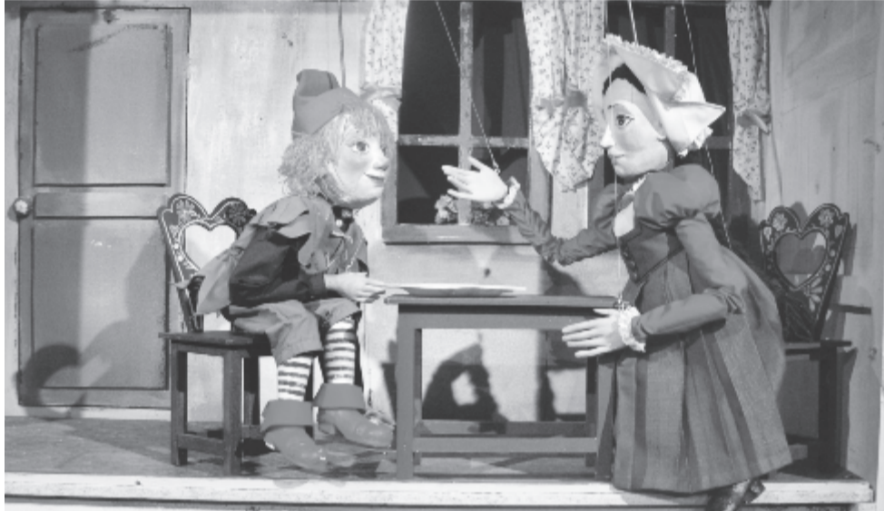
Az égig érő paszuly